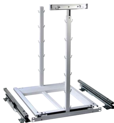
フロントブラケット付スライドフレーム