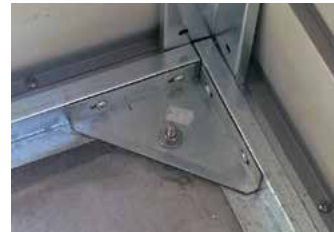
コーナーアンカー

基礎は左ページ [A] 内高基礎を推奨しておりますが、[B] フラット基礎の場合はウッドフロア（オプション品）で床を上げて下さい。