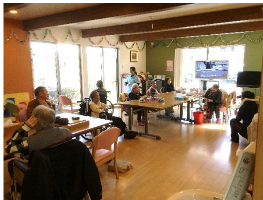
施設者の憩いの場