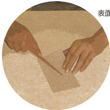
表面を整えスムーズに仕上げる