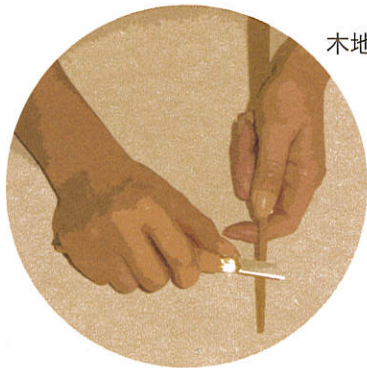
木地を成形し形を仕上げる

1~3で決めた形状をもとに、お手持ちのカッターナイフ・小刀等、または#240のサンドペーパーで決めたデザイン通りに木地を加工します。