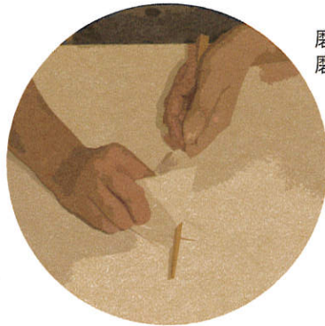
磨き用ペーパーで磨きながら拭き取る