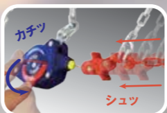
自動増し締め式 オートコネクター搭載