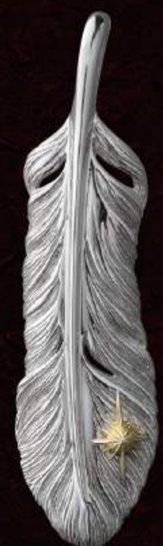
PENDANT (PGP-360-S) ¥26,800