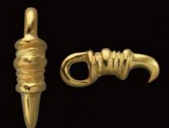
PENDANT (PG-412-S) ¥30,000