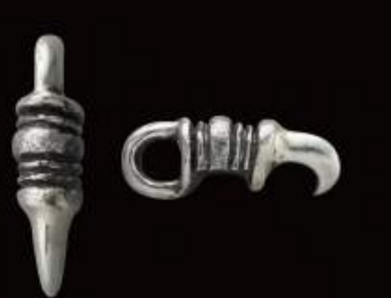
PENDANT (P-412-S-OZ) ¥4,000