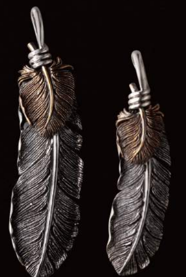
PENDANT (P-314-S) ¥21,800 PENDANT (P-315-S) ¥17,800