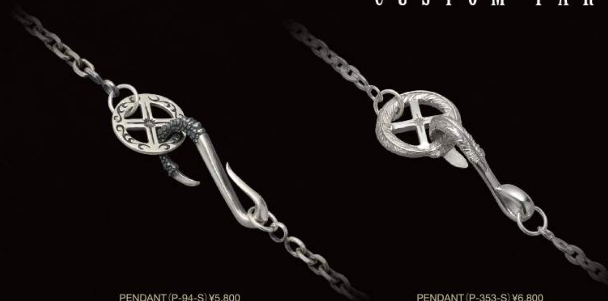
PENDANT (P-94-S) ¥5,800 CUSTOM HOOK ( BET-42) ¥8,000 TOTAL ¥13,800