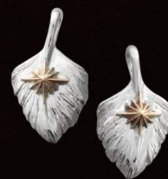
PENDANT (P-399-S-L) ¥5,800 PENDANT (P-399-S-R) ¥5,800