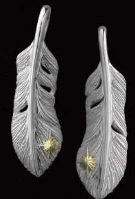
PENDANT (PGP-362-S-L) ¥19,800 PENDANT (PGP-362-S-R) ¥19,800