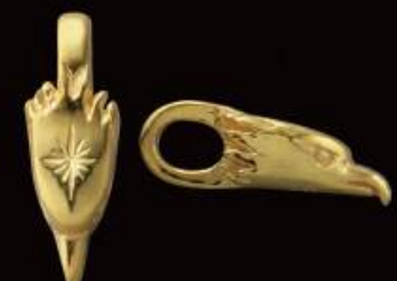
PENDANT (PG-411-S) ¥30,000