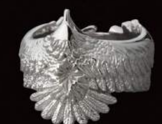
RING (R-87-S) ¥17,800