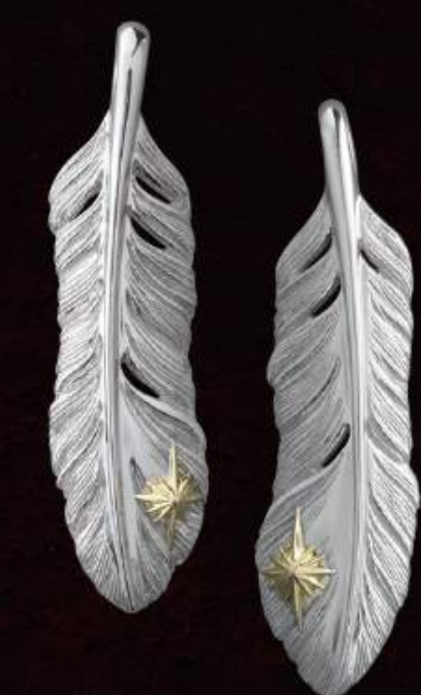
PENDANT (PGP-361-S-L) ¥23,800 PENDANT (PGP-361-S-R) ¥23,800