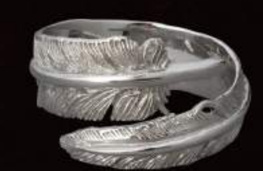
RING (R-88-S) ¥14,800