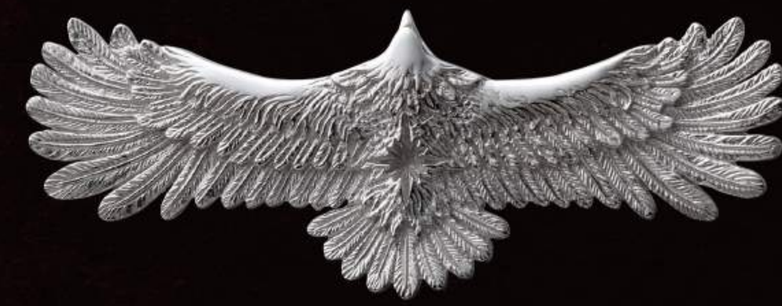
PENDANT (P-352-S) ¥37,800