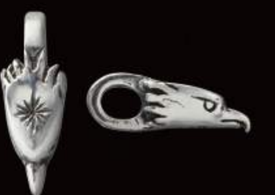
PENDANT (P-411-S-OZ) ¥4,000