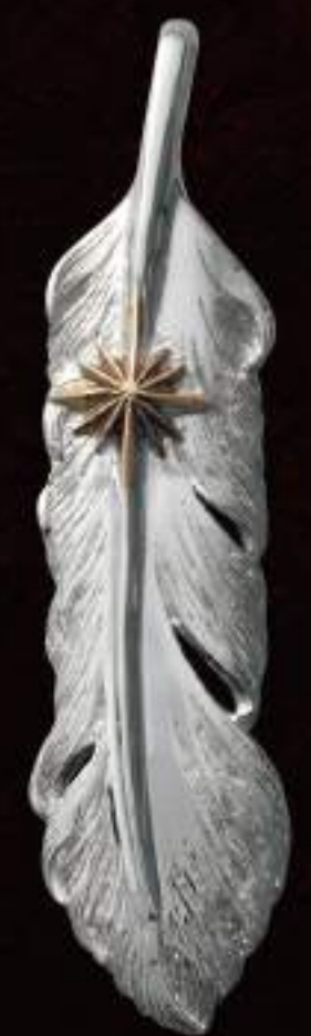
PENDANT (P-398-S-L) ¥14,800