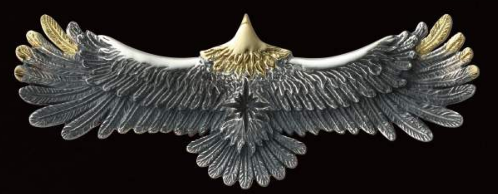
PENDANT (PGP-352-S-OZ) ¥89,800