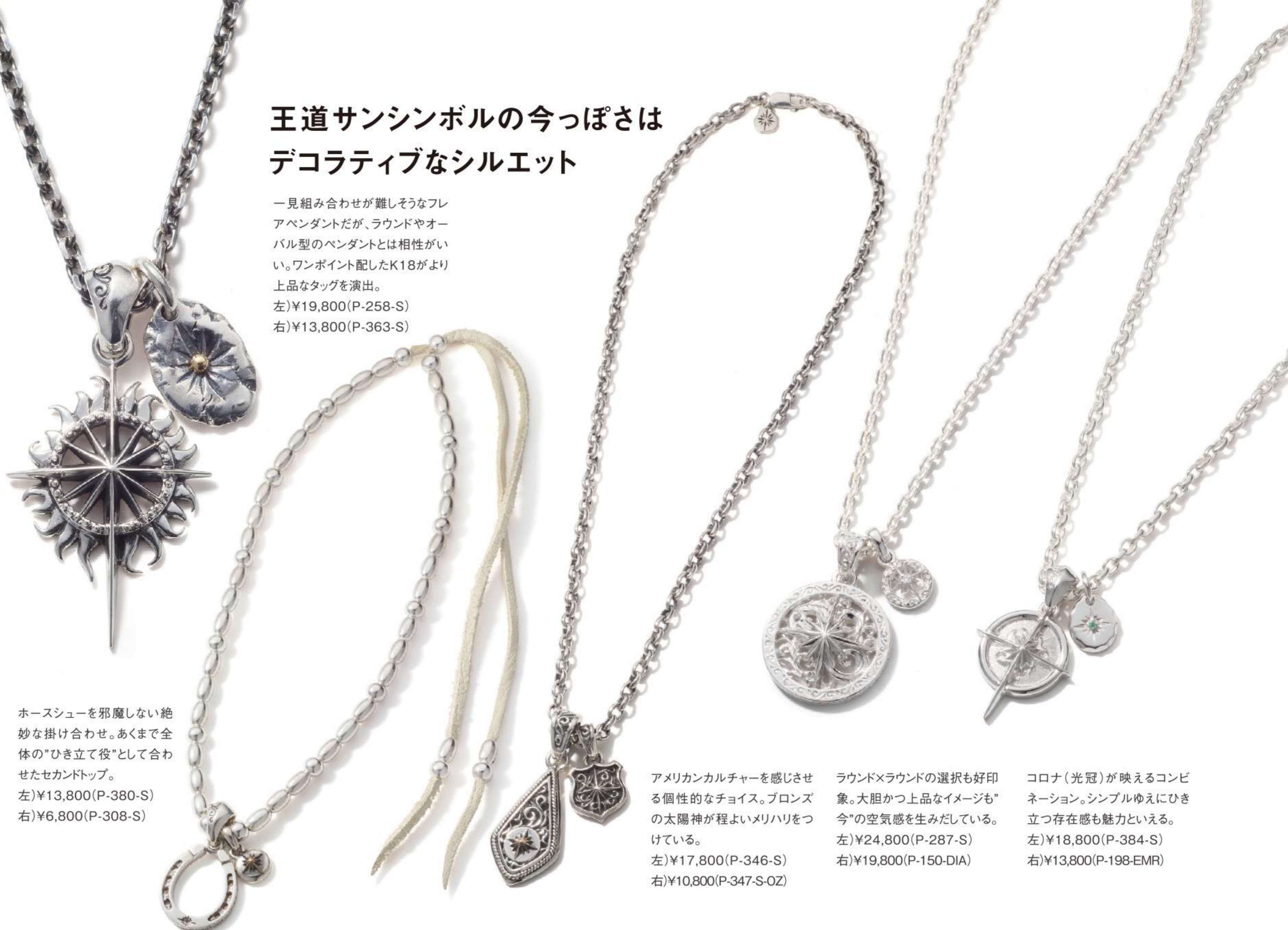
ホースシューを邪魔しない絶妙な掛け合わせ。あくまで全体の「ひき立て役」として合わせたセカンドトップ。 左) ¥13,800 (P-380-S) 右) ¥6,800 (P-308-S)

一見組み合わせが難しそうなおフレアペンダントだが、ラウンドやオーバル型のペンダントとは相性がいい。ワンポイント配したK18がより上品なタッグを演出。 左) ¥19,800 (P-258-S) 右) ¥13,800 (P-363-S)