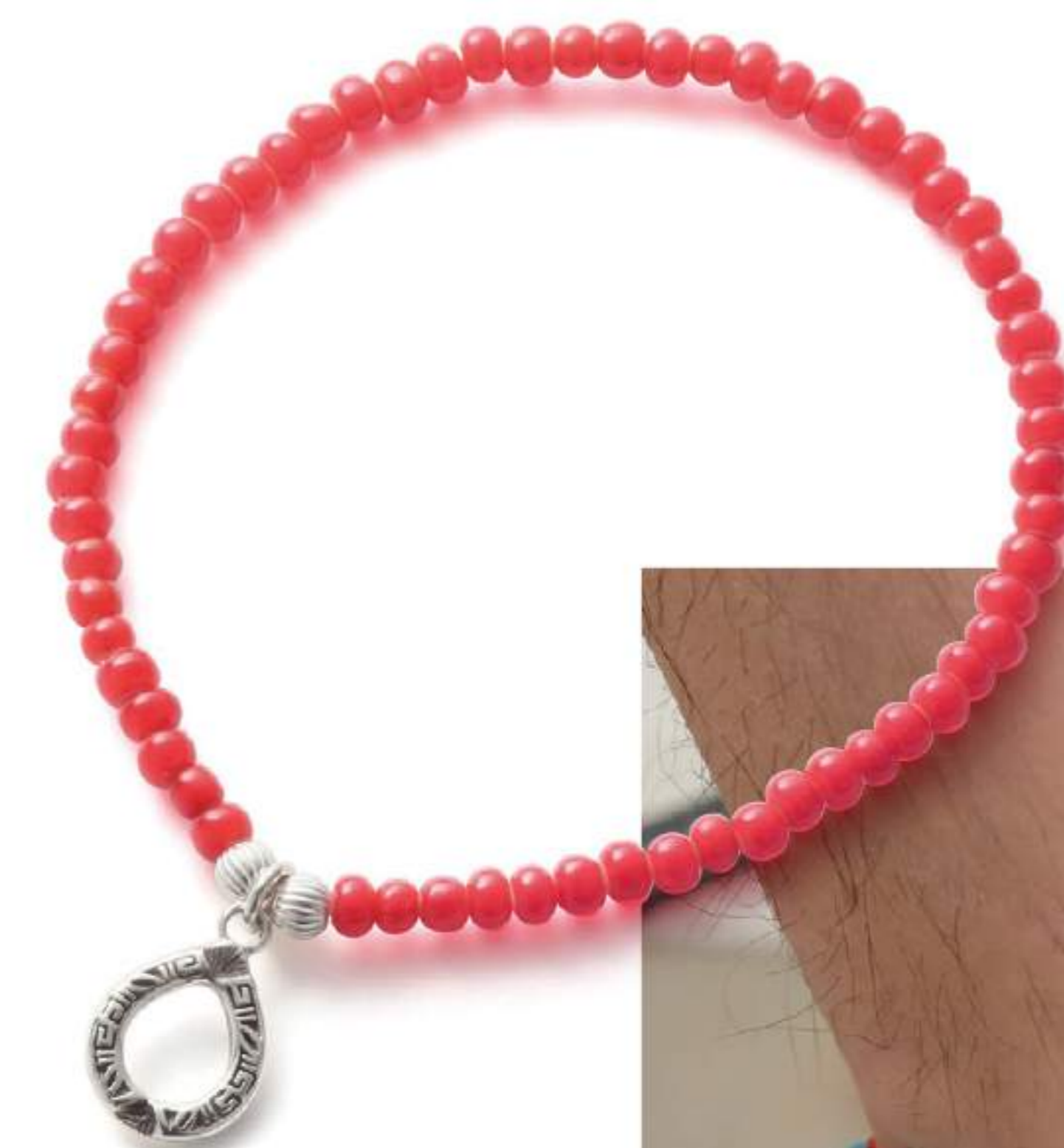
色使いを基調としたアンクレットが足元を昇華する。 ターコイズアンクレット ¥17,000 ホワイトハーツアンクレット ¥7,500