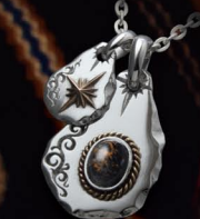
同モチーフによるバランスのとれた重ね付けペンダント。平打ち部分の経年変化も楽しめるアイテム。 PENDANT / ¥24,800 (P-166-PTS) PENDANT / ¥12,800 (P-282-S) TOTAL / ¥3,7600 ※チェーンを除いた価格となります