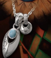
太陽神ペンダントを使った重ね付けペンダント。アクセントを加えたい方にオススメ。 PENDANT / ¥18,800 (P-52-LRM) PENDANT / ¥8,800 (P-265-S) TOTAL / ¥27,600 ※チェーンを除いた価格となります