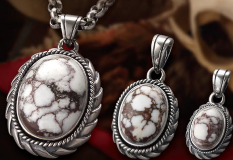
ワイヤーワークを施したフレームは大・中・小のラインナップ。ペアで着けるのもオススメです。 左) PENDANT / ¥39,800 (P-157-WDH) 中) PENDANT / ¥17,800 (P-158-WDH) 右) PENDANT / ¥15,800 (P-159-WDH) ※チェーンを除いた価格となります

非常に深い歴史を持つワイルドホース。ネイティブ・アメリカンの間では奇跡を起こす石・幸運を呼ぶ石として特に神聖な石として大切にされていた。希少な石でワイルドホースマグネサイトとも呼ばれている。