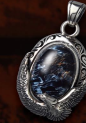
イーグルモチーフのペンダント。チェーンももちろんだが、ピースとの相性も抜群。 PENDANT / ¥31,800 (P-14-PTS)

SAADSTONEの中でもラージサイズの天然石。存在感漂う逸品。 PENDANT / ¥39,800 (P-157-PTS) ※チェーンを除いた価格となります