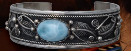
フェザーをあしらったバングル。サイズも調整可能なユニセックスデザインとなっている。 BANGLE / ¥36,800 (B-3-LRM)