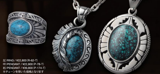
左) RING / ¥22,800 (R-62-T) 中) PENDANT / ¥22,800 (P-78-T) 右) PENDANT / ¥39,800 (P-174-T) ※チェーンを除いた価格となります

ターコイズは繁栄・成功を象徴する宝石として重宝されてきました。また、古来、世界各地の民族によって「お守り」として愛用されてきた。ネイティブアメリカンにとっては、特別な存在であったと伝えられています。