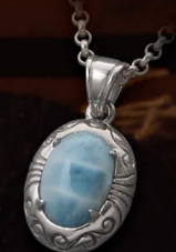
アラベスクをあしらったペンダント。天然石が更にひきたつシンプルなフレーム。 PENDANT / ¥19,800 (P-4-LRM) ※チェーンを除いた価格となります