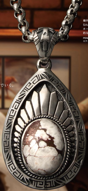
SAADロングセラーのイーグルモチーフのフレーム。ワイルドホースをセットすることでより存在感をかもし出す。 PENDANT / ¥29,800 (P-14-WDH) ※チェーンを除いた価格となります

幾何学模様が印象的なフレームにSAAD NEW STONEのワイルドホースをセットしたペンダント。圧倒的な存在感を放つ逸品である。 PENDANT / ¥48,800 (P-170-WDH) ※チェーンを除いた価格となります