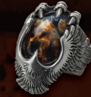
イーグルカラーをモチーフにしたリング。石とのバランスも絶妙な珠玉の逸品。 RING / ¥33,800 (R-57-PTS)