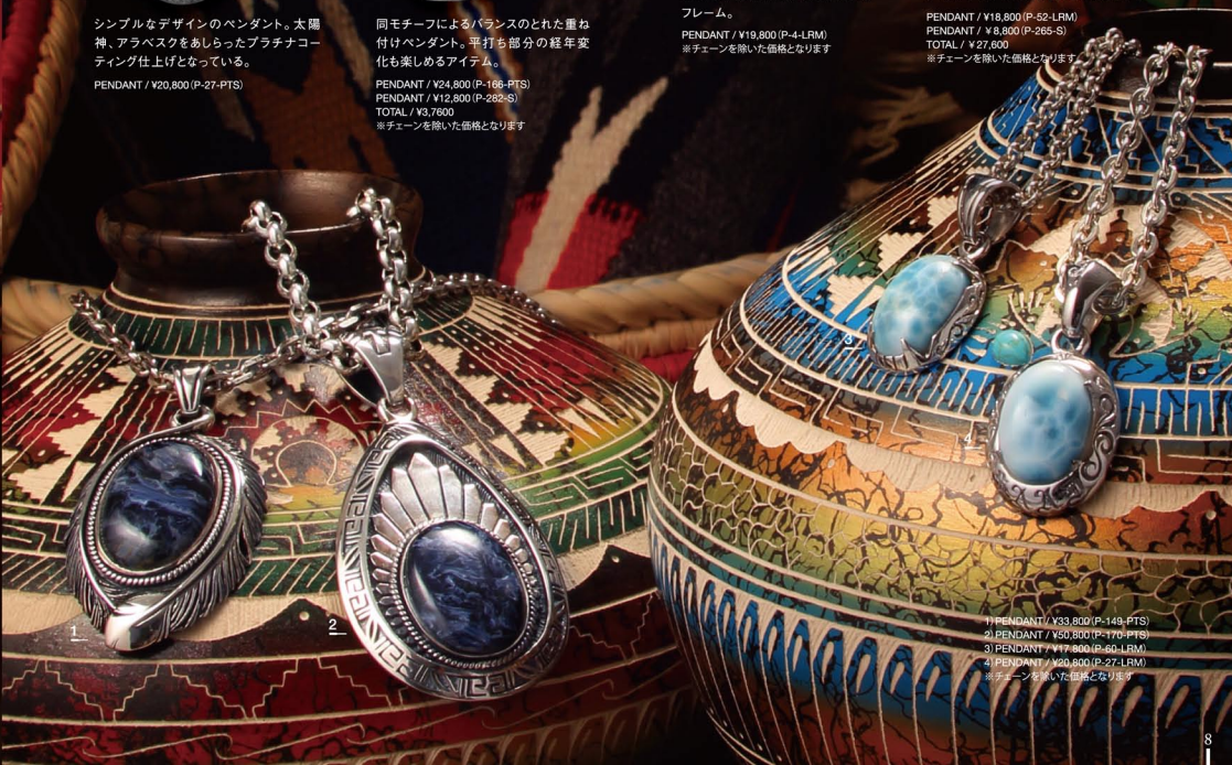
1) PENDANT / ¥33,800 (P-149-PTS) 2) PENDANT / ¥50,800 (P-70-PTS) 3) PENDANT / ¥17,800 (P-60-LRM) 4) PENDANT / ¥40,800 (P-27-LRM) ※チェーンを除いた価格となります