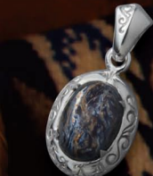
シンプルなデザインのペンダント。太陽神、アラベスクをあしらったプラチナコーティング仕上げとなっている。 PENDANT / ¥20,800 (P-27-PTS)