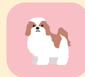
べたつきやすい肌