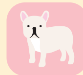
部分的にべたつきやすい肌

NEXT! 次ページで、ワンちゃんの肌質とケア頻度に合わせたフランス生まれのビルバックスキンケアシリーズをチェック!