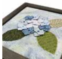
出来上がりサイズ(約): 21cm×21cm

5月が終わると梅雨はすぐそこ。 立体的な花びらとギザギザ葉っぱのあじさい。 水玉の傘がかわいいすーちゃん。 雨の季節にぴったりのタペストリーを作ります。 あじさいは、葉っぱの大きさと花びらの位置を 変えれば衣桁に下げて飾ることもできます。 刺しゅうをするときは刺しゅう枠を使ってくださいね。