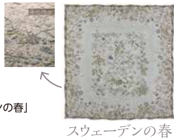
スウェーデンの春