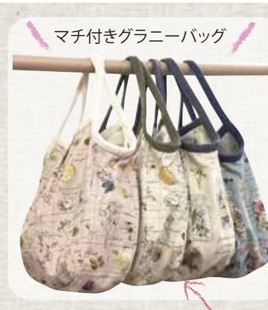
マチ付きグラニーバッグ

適切な厚さの綿麻キャンバス地(表面で紹介しているA12,A13,A14,A15の生地)を使ってバッグを作りました。 布とテープの色は自由に組み合わせてくださいね。 裏布はA01~A06,A08,A09がおすすめです。 用尺 表布 裏布 …… 各40cm 3cm幅テープ …………… 1.6m