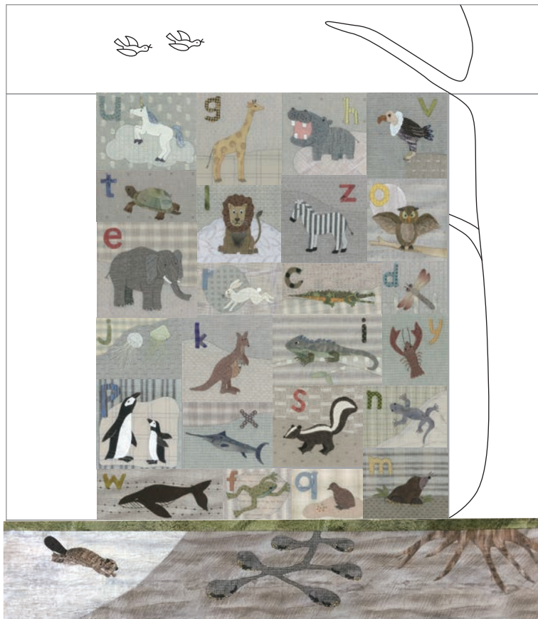
完成予定サイズ(約): 横 110 cm × 縦 120 cm程度 アップリケの位置やデザインは、変更になる場合があります。