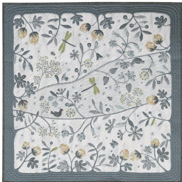
出来上がりサイズ(約):縦68cm×横67.6cm

1枚のパネル布でタペストリーやバッグ、ポーチなどが作れます。 柄に沿ってキルティングを入れるだけなので楽ちん! 柄のないところは「NEW オリジナル Wave Template」を使う と波型のキルティングラインが引けるので便利です。