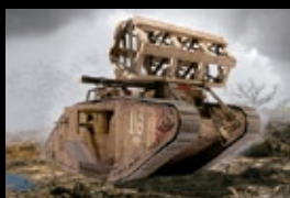
イギリス重戦車 Mk.V (メール) モンモデル 1/35 スティープ・ザロガ