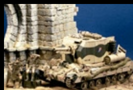
英・25ポンド自走榴弾砲ピショッブ プロンコ 1/35 ジョセ・プリト