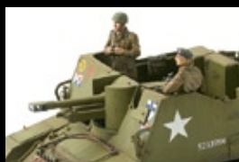
カナダ陸軍 セクストンII 後期生産型 ドラゴン 1/35 大楽直正