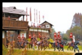
戦国ダイオラマ絵巻 大坂冬の陣 真田丸攻防戦 八塚俊尚