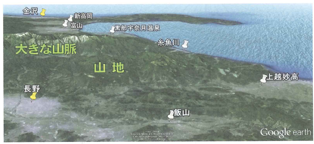
図2 新幹線のコース その2 [グーグルアースで作成]