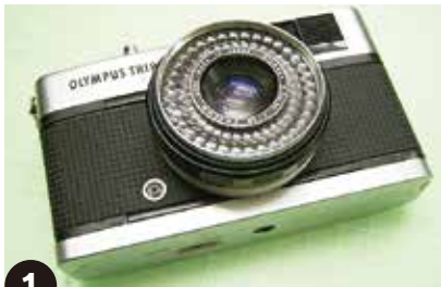
1 オリンパストリップを新しい革に張り替えます。