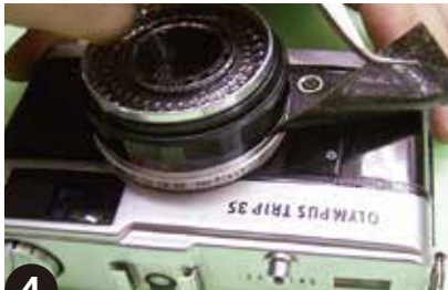
4 前面は形が複雑ですので、より慎重にゆっくりはがします。