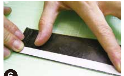
6 はがした原型革の裏に、市販の両面テープを貼り付けます。角のぴったり合うように貼ってください。