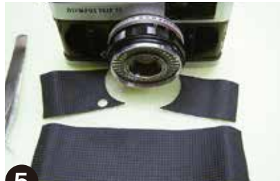
5 前面2枚、裏面1枚、計3枚の革をはがれました。この3枚の原型をもとに、新しい革を製作します。