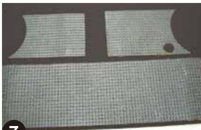
7 両面テープをはがした原型革を、新しい革の上のせ、しっかり貼り付けた後、原型革のラインに沿って革を切断します。