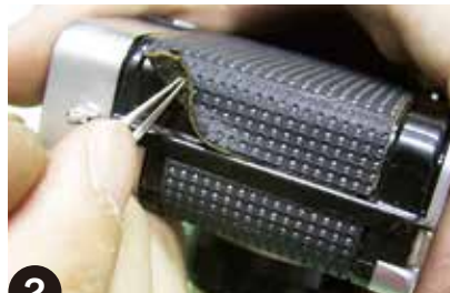
2 ピンセット使用し、本体に傷をつけないように角から革をめくります。はがした革が原型になるので破かないように慎重に。