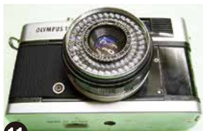
11 穴のある部分は、穴がずれないようにしっかり貼り合わせます。