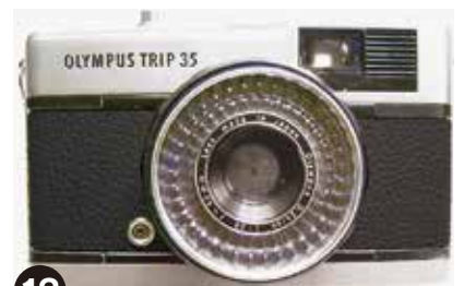
12 できました!お気に入りのカメラの革を張り替えて、新たな気分で撮影してみたいいかがでしょうか?