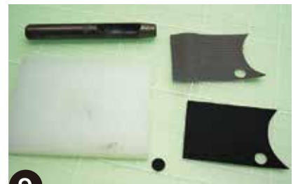
9 カッターでは不可能な穴の切り抜きも、ポンチを使用することで簡単に抜けます。右下が穴を抜いた革。