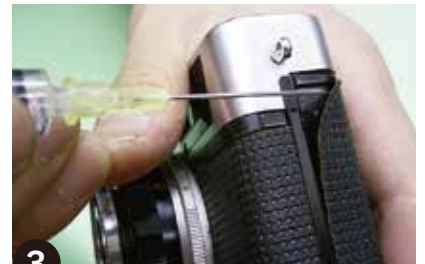
3 めくれた部分から注入器でアルコールを流し込み浸します。(固着しているボンドがとれやすくなります)