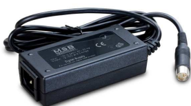
Desktop Power Supply