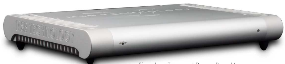
Signature Transport Power Base V