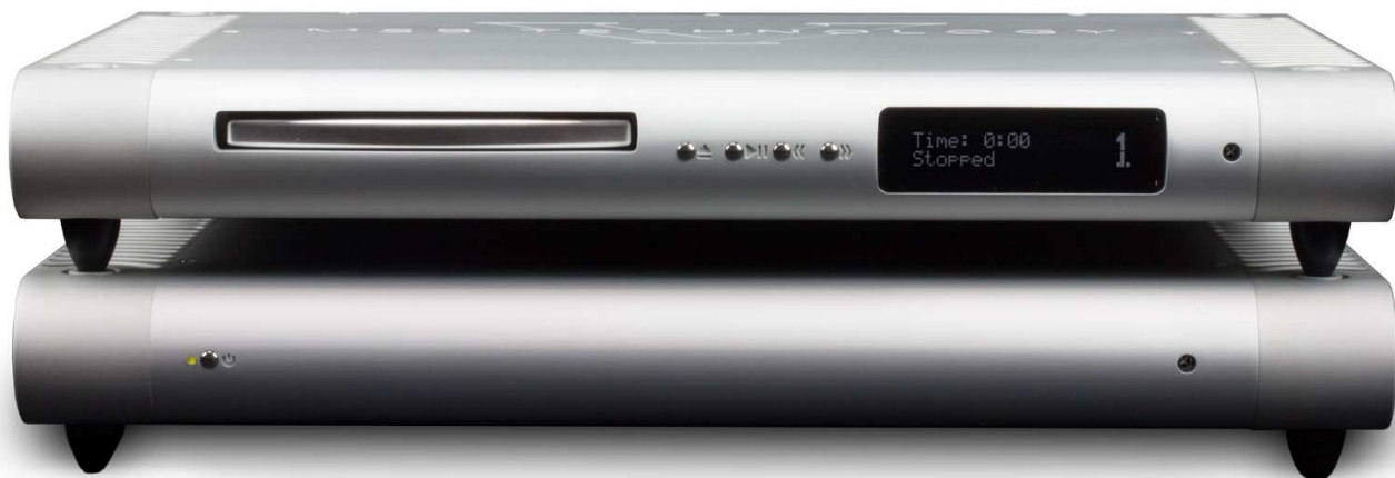
上: Signature Data CD V 本体 下: Signature Transport Power Base V