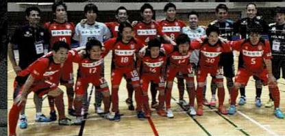
リガール東京 関東フットサルリーグ1部