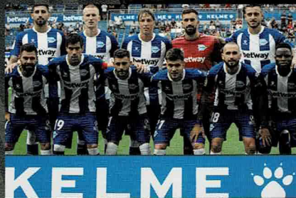
El Deportivo Alavés スペインサッカーリーグ1部