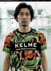
元バスケットボール選手 NO. 10 岩本昌樹