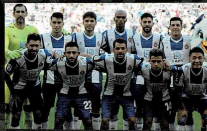
RCD Espanyol de Barcelona スペインサッカーリーグ1部