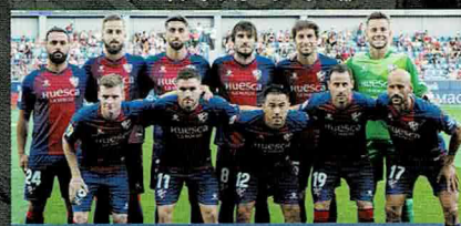
La Sociedad Deportiva Huesca スペインサッカーリーグ2部