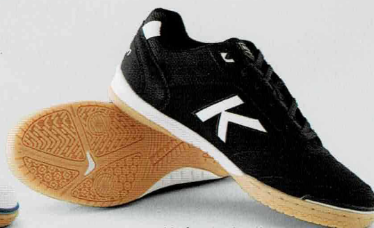
138 ブラック×ホワイト