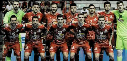
Elpozo Murcia F.S. スペインフットサルリーグ1部