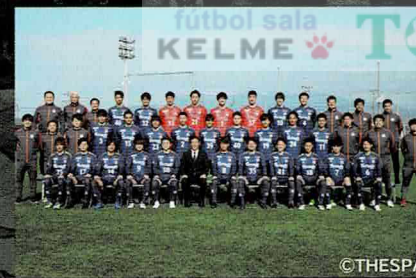
ガズバクサツ群馬 Jリーグ2部