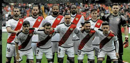
El Rayo Vallecano de Madrid スペインサッカーリーグ2部