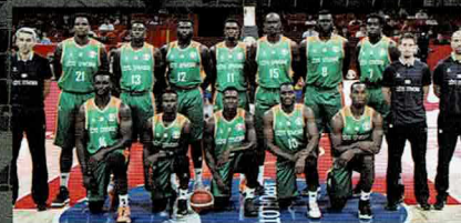
コートジボアール代表