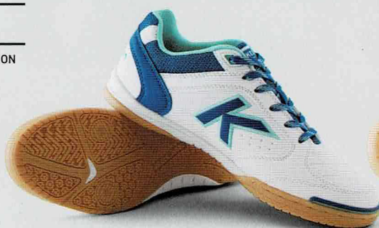
704 ホワイト×ロイヤルブルー