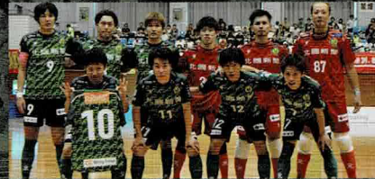
ヴィンセドール白山 Fリーグ2部