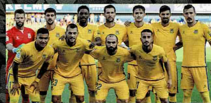
Asociación Deportiva Alcorcón スペインサッカーリーグ2部