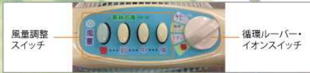
新林の滝 +PM2.5 ととるフィルター