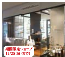
期間限定ショップ 12/25(日)まで! ヒルトンプラザウエスト 3F インテリアショップ コモプリウス 芦屋(大阪店)