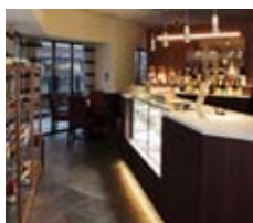
ラポルテ本館 2F レストランカフェ 野菜のごちそう