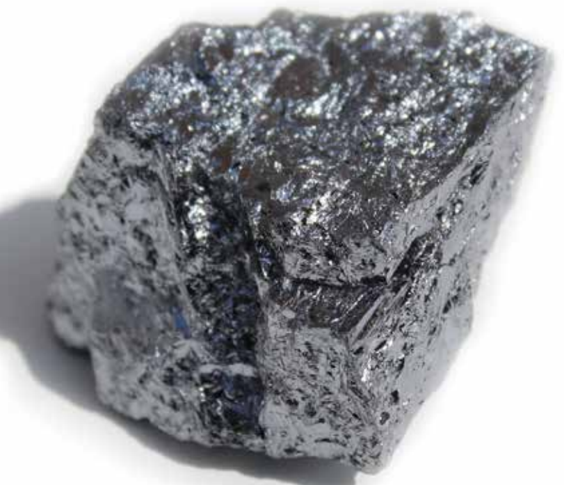
空間のパワースポット化に人気の、テラヘルツ波を放射する鉱石。周囲にパワフルなエネルギーが放たれ、「清々しい気分になる」「元気になる」と感じる方も。

しかも、物質の種類が無機質、有機質にかかわらず、その性質を良い方向に変化させることができます。