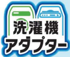
FB洗濯機用アダプター PM100-20