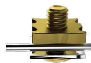
通常のワイヤーホールド

ワイヤー取付(右参照)は太鼓状(凸型)に膨らんだベースと凹型のナットで線材を強力に締め付ける機構。ワイヤーを凹型ナットのU字型ガイドで固定されるため接触面積は大きく確保され、ワイヤーが歪むことなくしっかりとホールドされます。